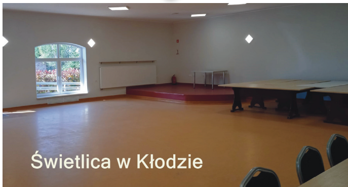
Świetlica w Kłodzie