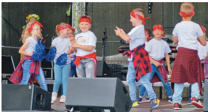
14 czerwca odbyły się "Wianki nad Zalewem", organizowane przez Rydzynski Ośrodek Kultury oraz Urząd Miasta i Gminy Rydzyna.

Rada Miejska Rydzyny w czerwcu na sesji zabezpieczyła 90 tys. zł na te zadania.