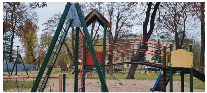
W 2025 roku ma być remontowany plac zabaw przy ul. Zamkowej w Rydzynie. W listopadzie został ogłoszony przetarg.

Ostateczny wynik miasta i gminy Rydzyna na rzecz WOŚP wyniósł 62. 802,58 zł!