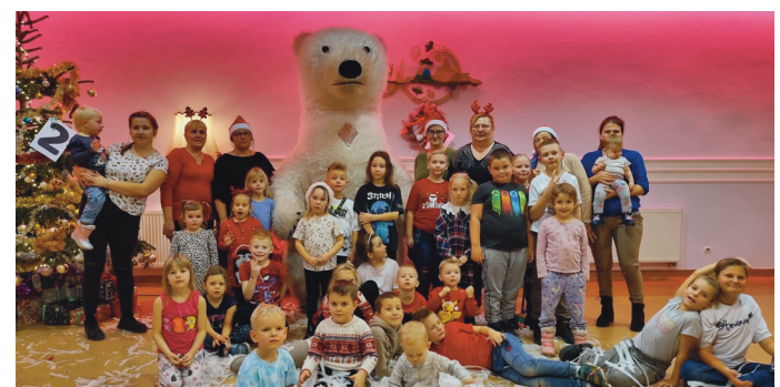
4 grudnia w Tarnowej Łące zjawił się św. Mikołaj. Do Sali Wiejskiej na spotkanie z dziećmi zaprosili go: sołtyśka, Rada Sołecka i Koło Gospodyń Wiejskich.