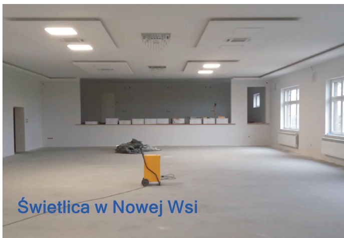
Świetlica w Nowej Wsi

W Nowej Wsi remont sali głównej (III etap) kosztował 185,6 tys. zł, w tym dofinansowanie z budżetu województwa wielkopolskiego wyniosło 70 tys. zł. Wkład własny Nowej Wsi wyniósł 25 tys. zł. Jeśli chodzi o budynek w Kłodzie wykonano stolarkę wewnętrzną i zewnętrzną oraz wy-