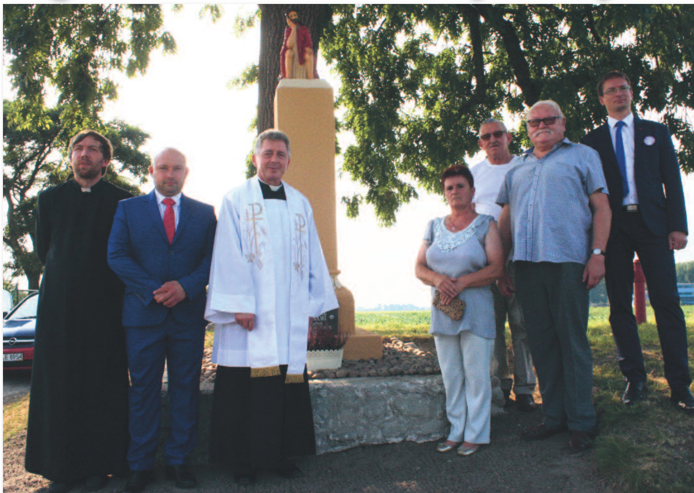
Figura wróciła na swoje miejsce