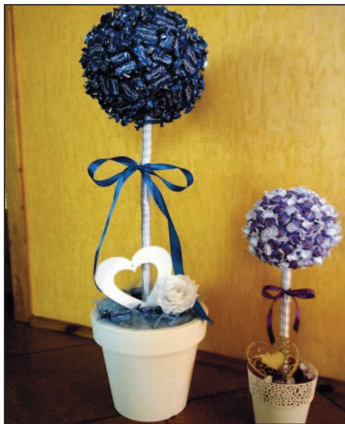
Hitem są drzewa z cukierków. Największe miały metr wysokości.