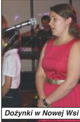
Dożynki w Nowej Wsi