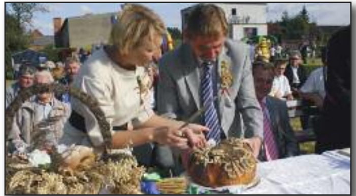
Dożynki parafialne w Kaczkowie odbyły się z udziałem mieszkańców Jabłonnej, Lasotek, Kaczkowa i Rojęczyna.