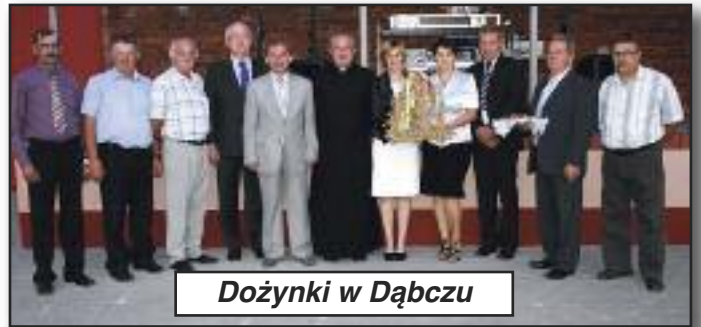
Dożynki w Dąbczu