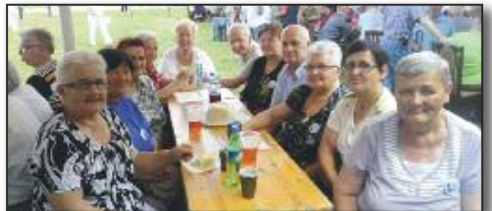
Na pikniku, na lotnisku w Lesznie spotkali się seniorzy z Leszna i powiatu leszczyńskiego. Skorzystali z zaproszenia organizatora imprezy, Zarządu Oddziału Rejonowego Polskiego Związku Emerytów, Rencistów i Inwalidów w Lesznie. Na zdjęciu: seniorzy z Koła w Kaczkowie.