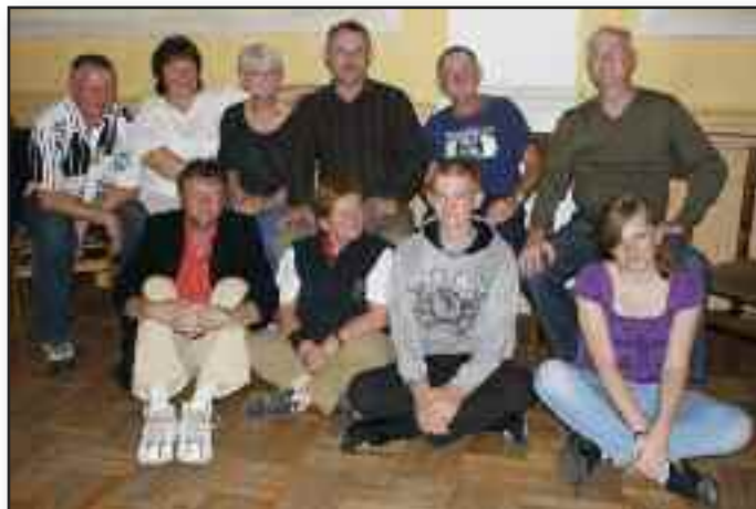
Część zespołu tuż przed próbą w Rydzynskim Ośrodku Kultury.