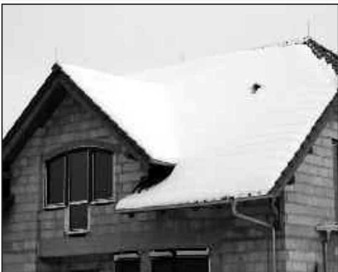
Piętnastocentymetrowa warstwa śniegu na metrze kwadratowym dachu to ciężar około 50 kilogramów.