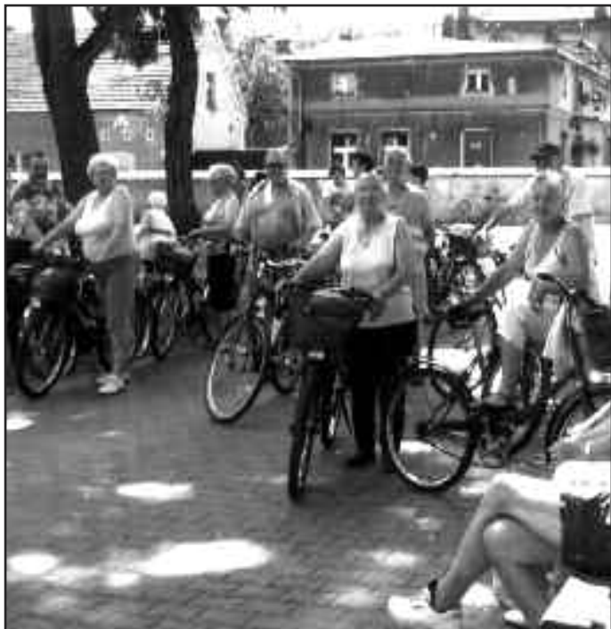
Rowerówki po okolicach gminy to wyprawy po zdrowie i doskonała forma integrowania osób zrzeszonych w Stowarzyszeniu "Złota Jesień".