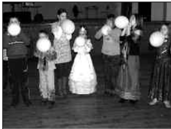
Panie z Koła Gospodyń Wiejskich i członkowie Rady Sołectkiej w Nowejwsi zorganizowali bal karnawałowy dla najmłodszych. Były tańce i konkursy, a co najważniejsze - fantastyczna atmosfera.