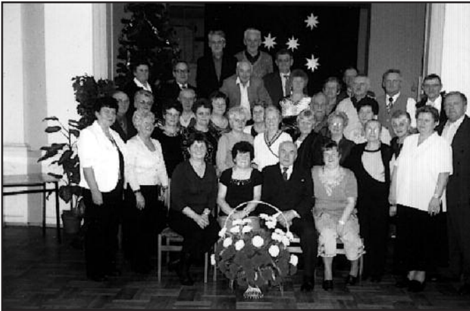
Jubilaci w gronie przyjaciół z Koła PZERiI.