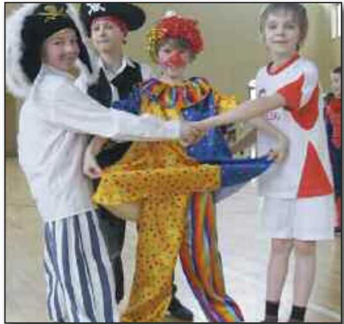
W tym od I do Szczeg Rodzic Wsi, kt

Koszt projektu to około 30 tys. złotych, dofinansowanie z Unii Europejskiej wynosi 22 tys. złotych. Dzień Wiatraka odbędzie się 31 sierpnia.