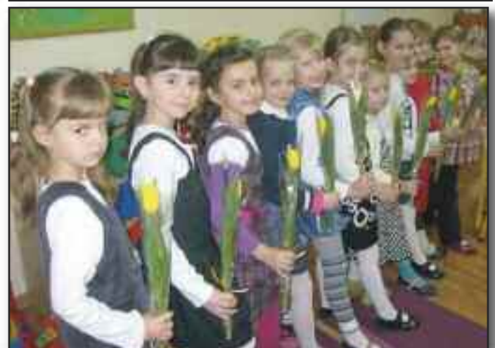
Chłopcy z Przedszkola w Rydzynie pamiętali o swoich kolegach, które 8 marca zostały obdarowane kwiatami. Dziewczyny podziękowały uśmiechami.

Pieniądze na budowę zbiornika pochodzą z Programu Rozwoju Obszarów Wiejskich na lata 2007-2013 oraz budżetu państwa.