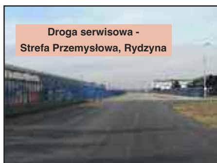
Droga serwisowa - Strefa Przemysłowa, Rydzyna