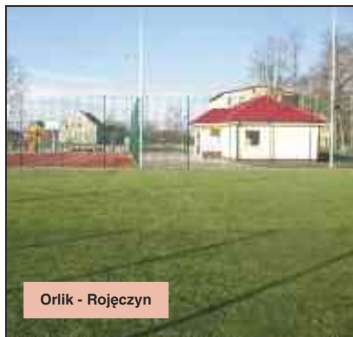
Orlik - Rojęczyn