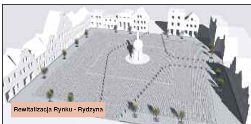
Rewitalizacja Rynku - Rydzyna