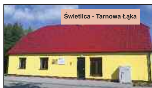
Świetlica - Tarnowa Łąka