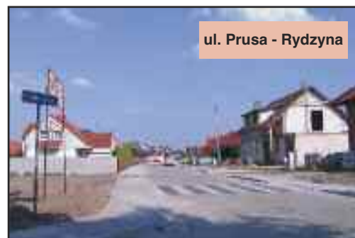
ul. Prusa - Rydzyna