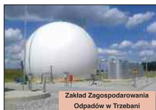
Zakład Zagospodarowania Odpadów w Trzebani