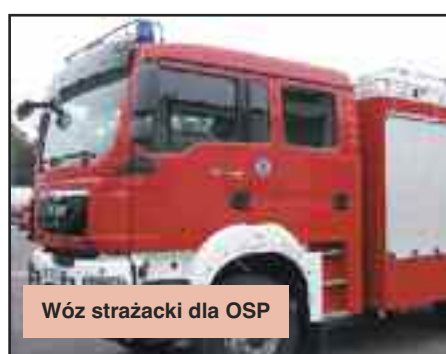
Wóz strażacki dla OSP