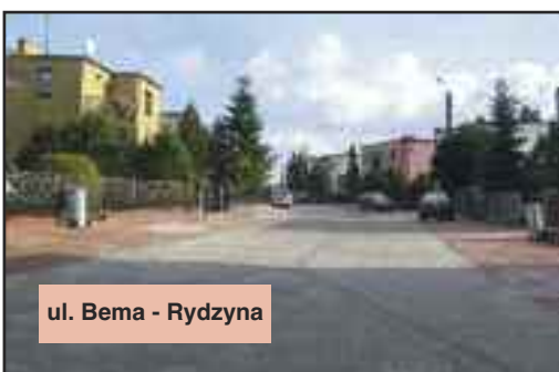
ul. Bema - Rydzyna