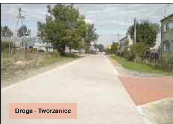
Droga - Tworzance