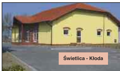
Świetlica - Kłoda