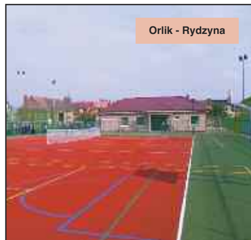
Orlik - Rydzyna