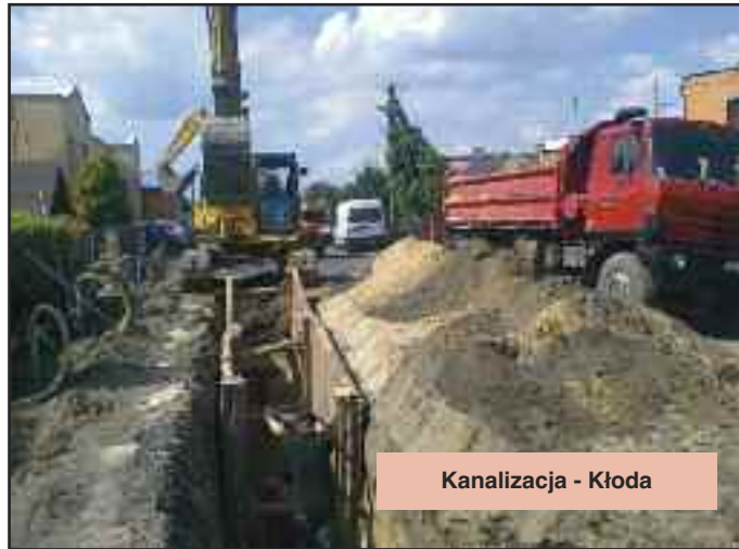
Kanalizacja - Kłoda

nansować zadanie. Wykorzysta- liśmy dobry moment na pozyskanie miliona dwustu tysięcy złotych z Mi- nisterstwa Sportu i Turystyki. Był to spory zastrzyk pieniędzy przy koszcie budowy około sześciu milionów złotych. Cieszę się, że ponad 60 procent gminy jest skanalizowane. W minionych latach prace trwały w Rydzynie, Dąbczu i Kłodzie. I tu na każdy etap również otrzymaliśmy dofinansowanie zewnętrzne. Po- wstawały nowe świetlice. Od nowa budowaliśmy ją w Kłodzie, w po- zostałych miejscowościach były modernizowane. Wymienię tylko Tarnową Łąkę, Kaczkowo i Mora- czewo. W Rojęczynie świetlica była modernizowana z myślą o młodo- dzieży szkolnej, by ta miała gdzie ćwiczyć podczas zajęć wychowania fizycznego. Za ponad 600 tys. zł za- kupiliśmy nowy samochód dla OSP Rydzyń, połowę tej kwoty pozyska- liśmy z zewnątrz. Wspólnie z 18 gminami braliśmy udział w projekcie pn. budowa zakładu zagospodaro- wania odpadów w Trzebanii oraz zam- knięcie i rekultywacja istniejących wysypisk odpadów (w tym wysypiska w Moraczewie) – ta ogromna in- westycja została dofinansowana z Europejskiego Funduszu Spójności w kwocie ponad 70 mln zł. Udział Gminy Rydzyń w tym projekcie wyniósł ponad 1,6 mln zł.