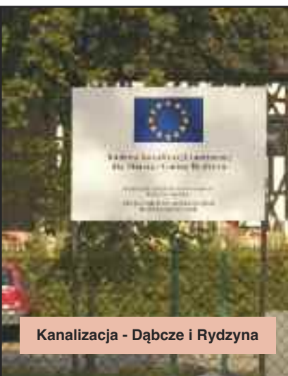
Kanalizacja - Dąbcze i Rydzyna