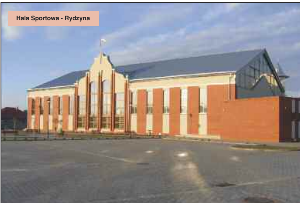
Hala Sportowa - Rydzyń