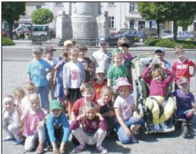
Dzieci z grupy starszej Przedszkola Publicznego w Rydzynie, poznając najbliższą okolicę, wybrały się na wycieczkę. W czasie spaceru było kilka przystanków, po to, by dzieci mogły obejrzeć zabytki Rydzyny i poznać związane z nimi historie.