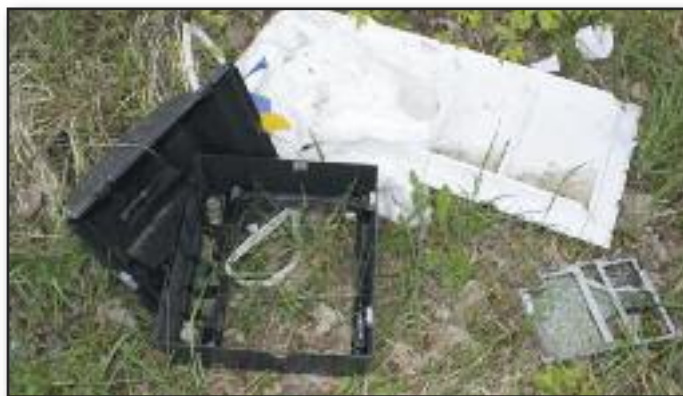
Tyle się mówi o dbaniu o środowisko. Niestety, w lasach wciąż można znaleźć podrzucone śmieci. A te na zdjęciu sfotografowaliśmy w niedalekiej odległości od zbiornika retencyjnego w Rydzynie.